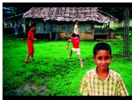
小朋友是難民們的未來希望。

書中著墨最多的，莫過於小孩子的教育。這些小孩子在當地出生，並受到資源的限制，常常到了學齡卻沒辦法就學，只能在家幫忙家計。其實泰國政府在二〇〇五年通過「全民教育協議」，規定在泰國境內的所有孩童皆有受教育的權利，其中包括無國籍的孩童與外勞子女。但礙於執行的困難性，加上偏遠地方環境差，老師不是未報到就是受不了而離開，所以當地的教育資源仍然缺乏。