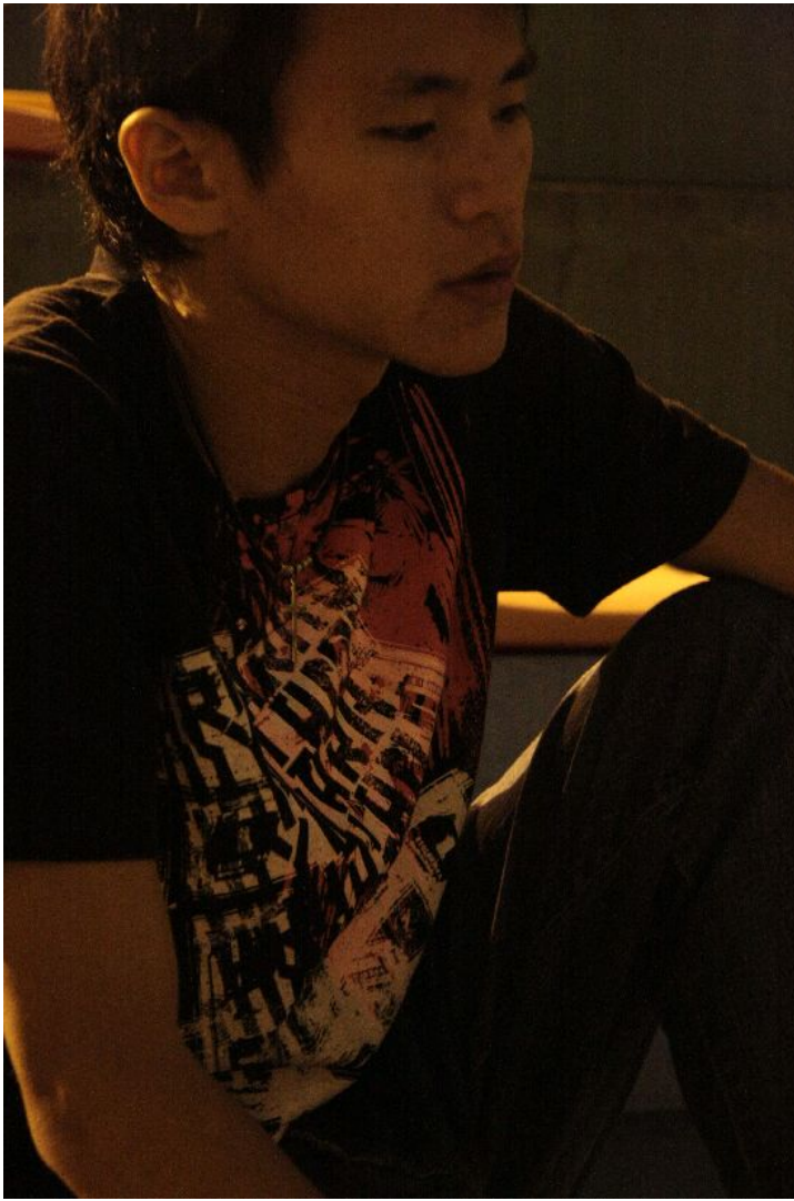
主唱坐在散席後的觀台，若有所思。