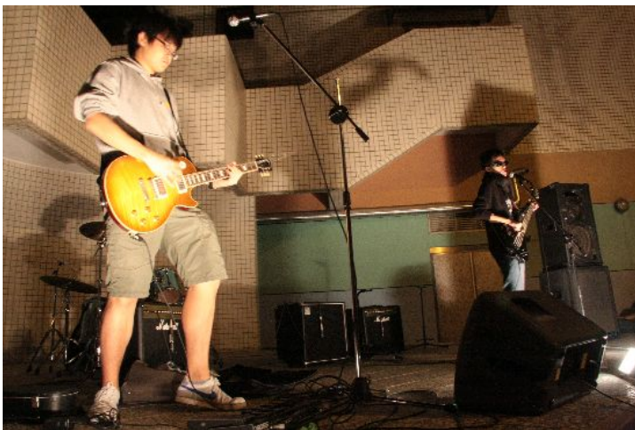
Burst團員只有三個人，一個主唱，一個吉他手，以及位在後方的鼓手。