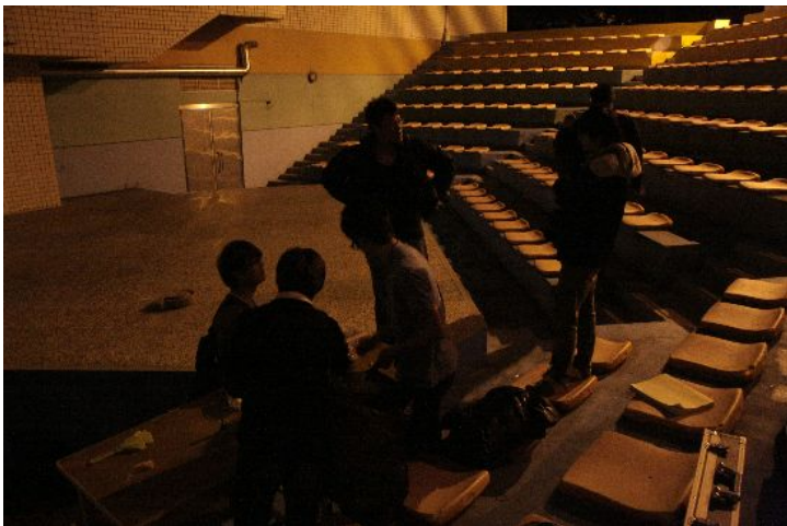
曲終人散。