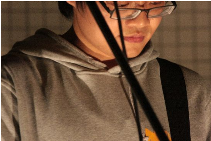
Burst樂團的吉他手。