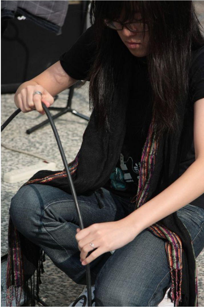
星聲社的團員幫忙打理纏亂的音源線。