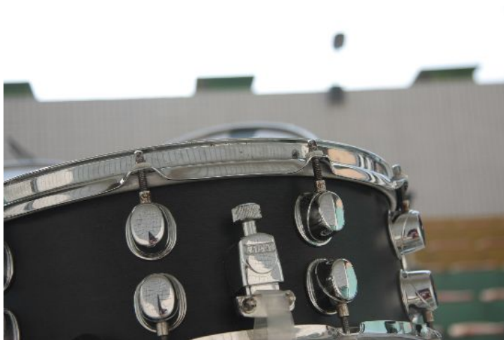
二〇〇九年十二月二日，星聲社burst樂團成果發表的日子。

對他們來說，每學期的成果發表都像是一場音樂的饗宴，但它更像是一則單純的故事。一個音符組成的故事，帶著夢想和期待，不知道從何說起，也不知道在哪裡劃上句號。打從三個人愛上音樂的那一刻起，生命裡就多了一些很特別東西，一些屬於他們自己的東西。