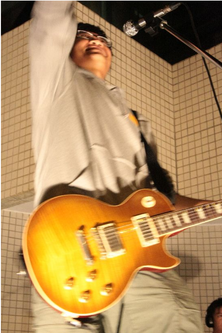
表演即將開始了。