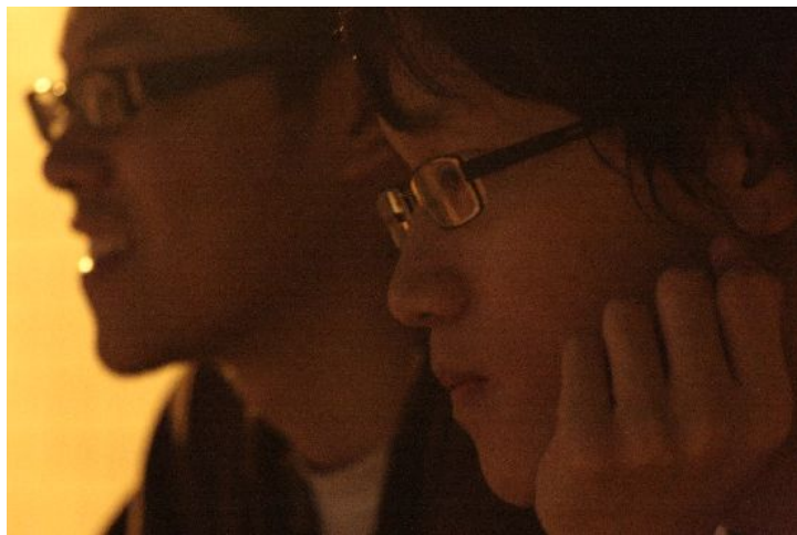
觀眾認真地看台上的表演。