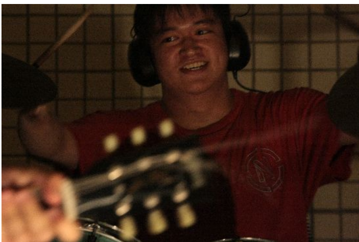
一直隱身在後面的鼓手。