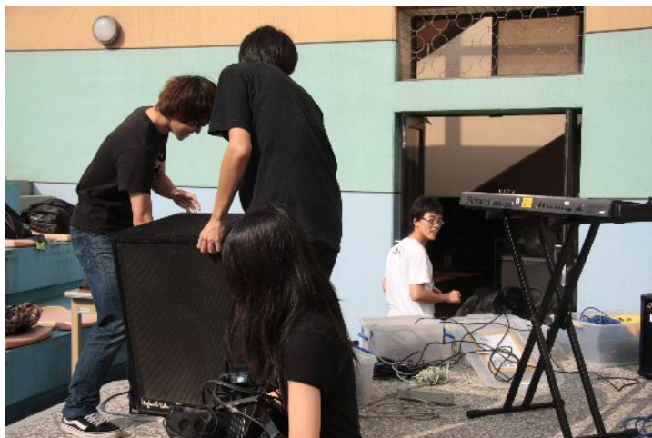
下午一點多，大太陽下開始架設晚上表演樂器。