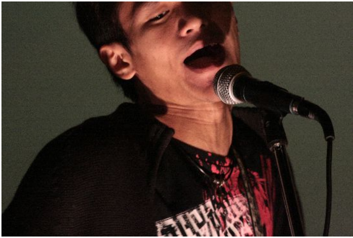
Burst樂團的主唱兼BASS手。