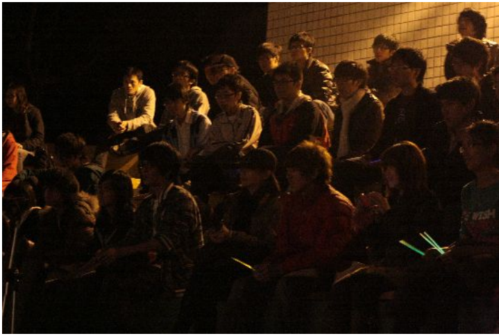
觀眾台上有許多前來觀賞的人。