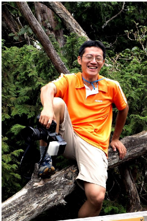
王裕龍的攝影技術極受推薦，常常擔任活動中的掌鏡人。

這樣一而再、再而三的機會與經驗雕琢出他不凡的攝影功夫。拍了幾年下來，王裕龍認為一個人對於環境的敏銳度是影響拍照結果的原因，而拍攝題材必須對於攝影者本身有一定程度的感觸，兩者適當地組合才會出現適合入鏡的構圖範圍。「跟在孔老師身邊，就是個傑出的攝影家了，我能教的就只是操作機器。」他強調攝影是一門心靈層次的活動，而非技術層次的行為。這些觀念養成了他的拍攝習慣與原則，這讓他的作品看起來不只是內容空洞的濫拍，而是具有結構的照片故事。