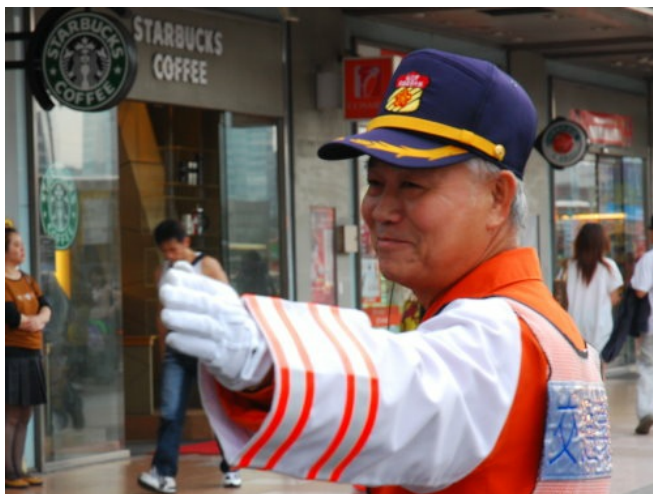
交通警察在施工前站上疏導交通的前線。

台北市自九十八年起提出「路平專案」，大刀闊斧地將全市道路維護更新，期許能夠提升市民用路品質，並達成施工流程標準化、教育訓練普及化及挖掘管理落實化的目標。