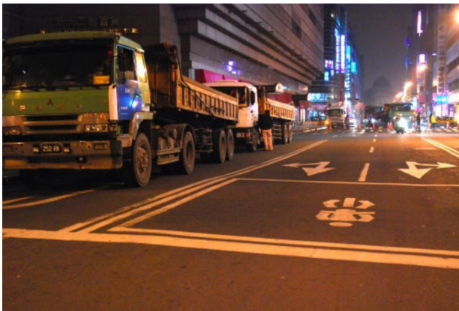
空蕩蕩的路上，只剩下工程砂石車緩緩進駐。