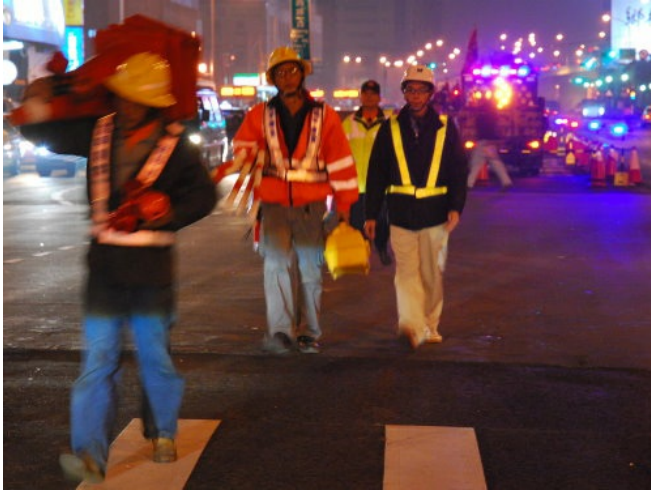
工程人員扛著器具步向分配的工作區域。