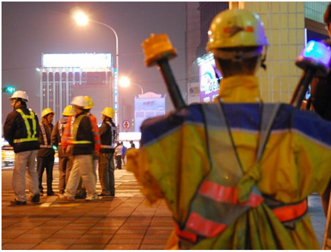
工程人員聚集在一起，午夜的台北市只剩下稀落的人群和正要上工的工人。