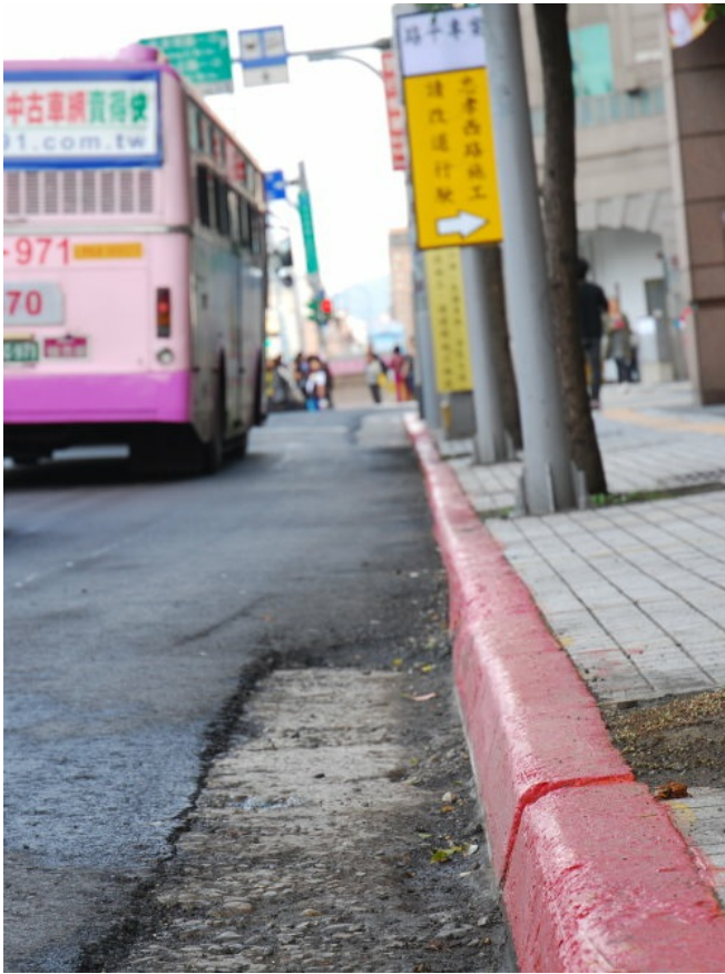
路面滿是開鑿過後的痕跡，路平專案真的路平了嗎？