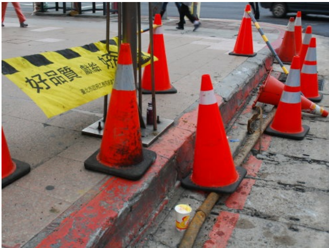
好品質獻給好市民？