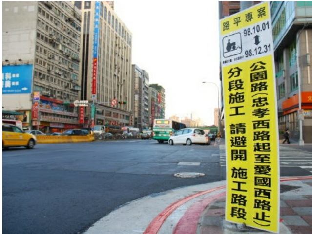
台北市路平專案希望利用六年時間進行路面更新。

台北市自九十八年起提出「路平專案」，大刀闊斧地將全市道路維護更新，期許能夠提升市民用路品質，並達成施工流程標準化、教育訓練普及化及挖掘管理落實化的目標。