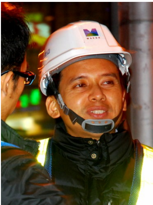
工程人員聚精會神地聽從主任分配工作。