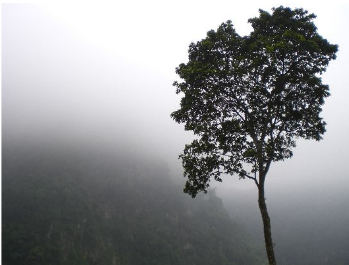
南清公路五峰段的路況，如詩如畫。

一路上夾雜著毛毛雨，不過他還是不疑有它地前進，即使天氣看不出有好轉的跡象，他仍相信這個雲雨帶的高度不會高過觀霧的海拔，到時候山上一定是個豔陽天。不久之後經過竹東下公館，考量到路途遙遠而山上加油站不多的關係，便在此處加滿油上路。往山區騎去，不變的是雨勢，更多的則是寒風與荒煙蔓草。路況多半一面臨山一面臨溪，偶有泰雅族朋友對著他招手，或是家族們在路邊準備的簡易筵席。越來越能看見路邊的原住民在活動，也引起他的好奇心，讓他打算回程時要把握機會與他們互動。