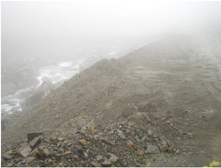
土場路況到處都是土石流場景，也許可以考慮改名。

進行道路修補，可是這麼長的路不知道要整修到何時，只能祈禱大自然的力量別再給大鹿林道太大的打擊，以免又要在這原本秀麗的風景中製造出更多的深淵。