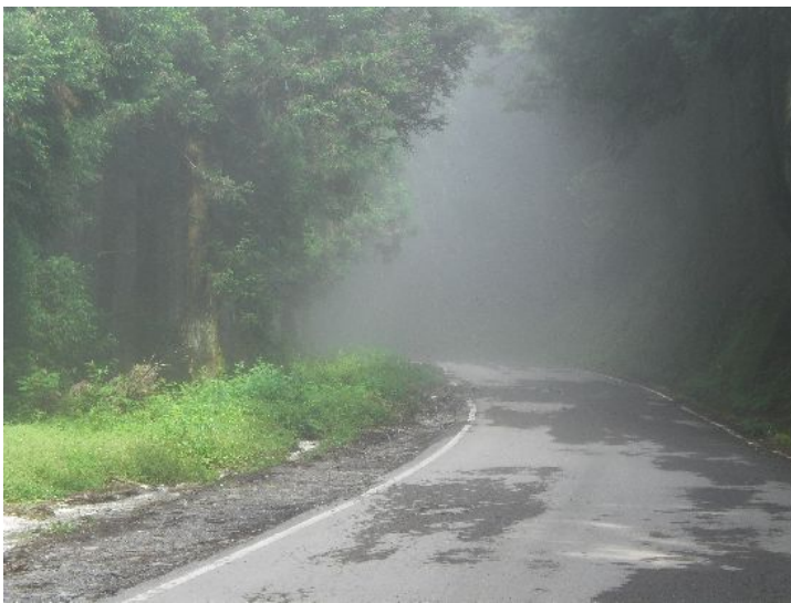
觀霧森林遊樂區，以森林與雲霧景觀著稱。（攝影／溫苔詠）

自21K的雪霸休閒農場後，雲霧漸開，路旁古木參天，林相單純。此處平常杳無人煙，畢竟一般的遊客看到土場的路況很難不想折返，而雪霸休閒農場又是大鹿林道上最後一間民宿。過了雪霸國家公園碑後，忽然看見金黃般的樂山基地，轉眼間，觀霧派出所就在眼前，第一次騎到那麼高的地方除了興奮，就是期待。可惜的是，區內大部分都規劃為復育區，只開放雲霧步道供遊客留連。區內最佳的展望便是遊客中心外的瞭望台了，從大霸尖到雪主這條十多公里長、十幾公里外、平均高度超過三千五百公尺的連峰就這麼映入眼簾，也難怪當年沼井鐵太郎披荊斬棘走完這一段路後，會用神聖的口吻將其命名為聖稜線。火石、頭鷹、奇峻、中雪四座山頭則座落在雪山西稜上，望過去猶如龍蟠虎踞之姿。林道東線的入口則標示大霸尖山登山口仍有20KM，並禁止公務車以外的交通工具進入。