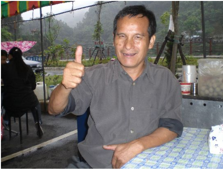
熱情的泰雅族老闆，貌似鄭弘儀。