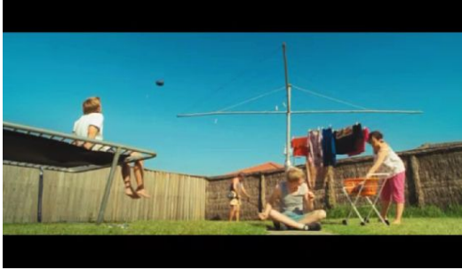
查理，就像天空飄過的一顆黑氣球，獨自遨遊，卻也渴望溫暖。

儘管如此，《The Black Balloon》的攝影與剪接仍令人激賞，每一個鏡頭感覺都是精心安排過後的說故事者。當導演在描述演員的心理時，有時會使用主觀鏡頭，讓觀眾看到主角當下眼中的世界，進而讓觀眾思考主角的心境。片中也有不少機會是一個鏡頭同時拍到家裡的四個人，仔細觀察每個人的行為、表情，都隱喻了當下的情緒以及接下來可能發生的事情。比如電影一開始在庭院的一幕，鏡頭採低角度觀看這四人，媽媽在做例行家事晾衣服；爸爸在後方做勞力家務除草；湯瑪斯無所事事地坐在彈跳床上，也不懂得要幫忙分擔家務；查理還是坐在地上，敲打永遠不會停歇的噪音。此時空中一把紅色氣球飛過，隨後緊接一顆黑色氣球飄來，彷彿在暗喻，有些人的世界就是無法像紅氣球一般令人驚艷，只能像那顆黑氣球，獨自在空中漫遊，直到墜落。