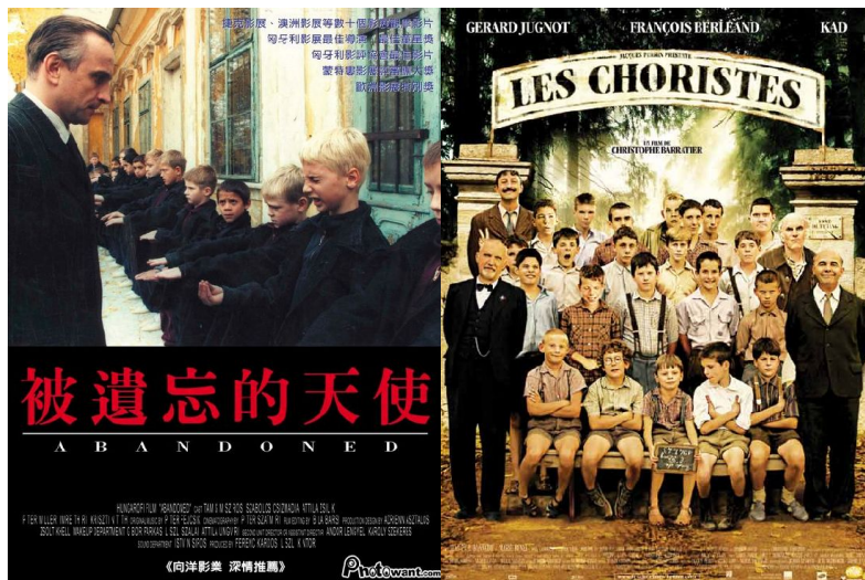
左：匈牙利的《被遺忘的天使》

這兩部片，一部產在法國、一部生在匈牙利，情節相似度卻是極高。同樣描述一群被非人道待遇的孩子們，同樣有一位熱愛音樂的老師扮演正面誘導的角色，也都有一名看了令人唏噓的冷酷院長，然而兩部戲的某些鏡頭也試著表達身為校長的無奈與關愛，並非單單負面的形象而已，可見作者對校長角色的期待。《放牛班的春天》以馬修老師為故事主軸，從他的眼中看這一群參差不齊的孩子，使他們的生命中出現一道曙光。而《被天堂遺忘的天使》則是以新來的院童亞倫為主角，從他在孤兒院成長的過程窺看當時匈牙利的社會體制和文化背景，以及孩子們追求善良不得不與大人反抗的高能動性。