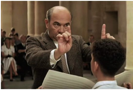
馬修不放棄任何教育孩子的機會，帶領他們走向人生的光明。

《放牛班的春天》送給這群孩子們一個最大的禮物，就是馬修老師。馬修用音樂的魔法點醒了池塘底的孩子，展現了身為老師春風化雨的風範，對於那些反骨、行為偏差、有勇無謀的學童分別採取適當的教育方式，面對冷酷暴虐的校長，馬修不畏高壓的風骨更是令人激賞。然而電影並沒有將馬修捧為英雄人物，他也有自己失意的時刻，當他煩惱著如何帶領孩子走進下一步，平時眼中自信、慈愛的眼神也透露出黯淡。