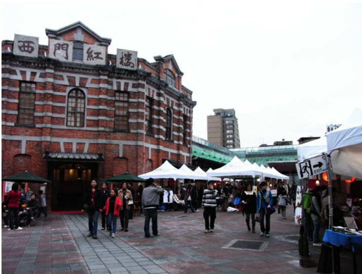
西門紅樓廣場每個假日都會舉辦創意市集。

西門紅樓佇立在台北的西門町鬧區旁，由於近年來，常常有許多藝文活動在這棟磚紅色的老古蹟中舉辦，儼然已成為一個小型藝文中心的紅樓，為西門町帶來一股清新的人文氣息，而每到假日，台灣藝術市集協會會定期在紅樓廣場舉辦創意市集，為手工藝術創作者提供一個平台與市場。