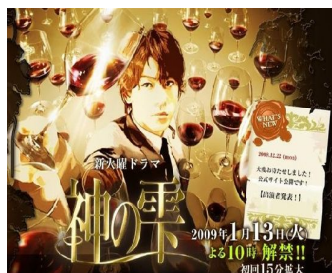
日劇《神之零》海報。

一切諸多的巧合，也是《神之零》不可思議的地方，主角神咲零總是靠著過人的感受力，以及強烈的運氣，在使徒的謎語公佈後，總是能找到自己所認為的答案，很巧合的遇到某些事件，又很巧合的都可以找到有關使徒謎題的線索，在數不清的葡萄酒海裡大海撈針，在許多意外裡找到答案，只能說或許真的有神在幫助。