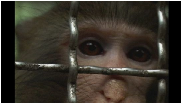
關太久的猴子會想落跑是天經地義的事，而人類去抓住牠們也同樣毫不猶豫。