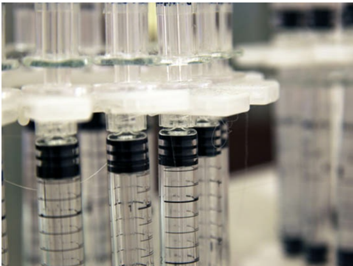
藝人如果只是用整形稍微修飾一下，被大眾接受的程度比較高。 圖為微整型常用之玻尿酸的注射筒。

韓國的整形風氣，隨著韓流來襲也吹向台灣，藝人們真真假假的面孔，有的人還是願意追隨，有人則排斥人工改變樣貌的作法。就連喜歡韓國明星的粉絲團內部，對於自己所喜愛的偶像整形，也有正反不同的意見。