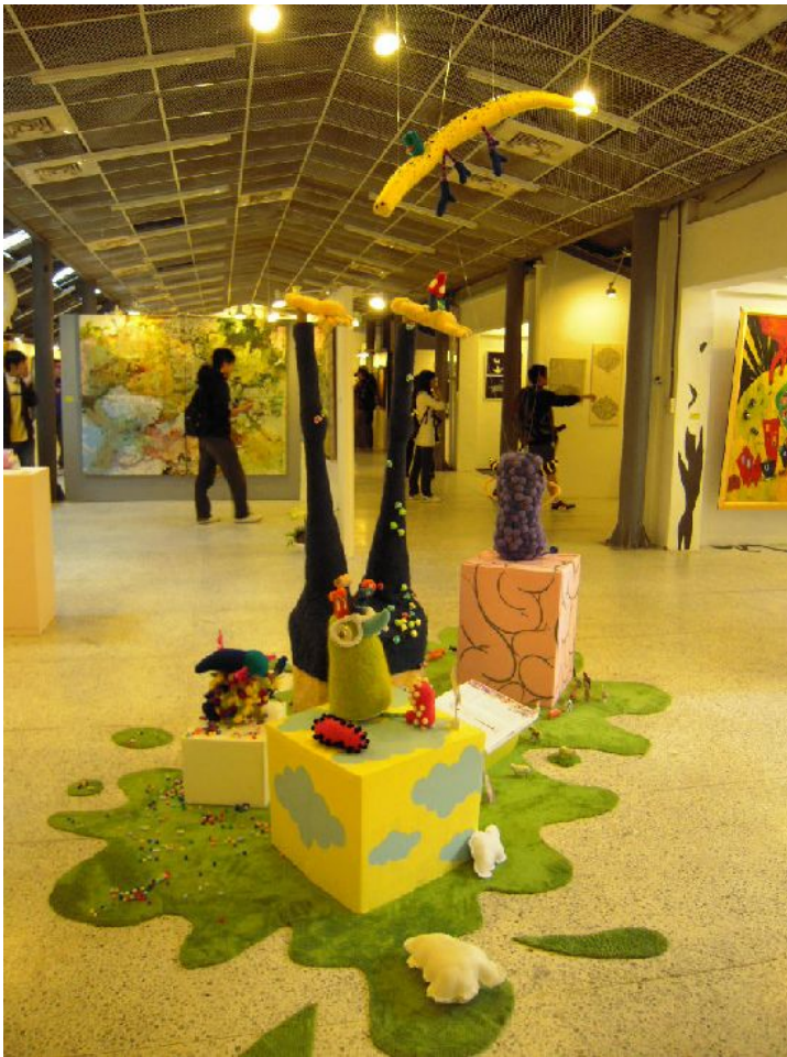
在眷村博物館參觀，大家為藝術品的美所折服。