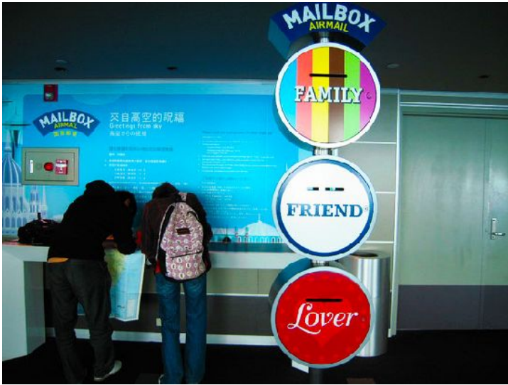
同學們在台北101的觀景台上蓋章以留作紀念。