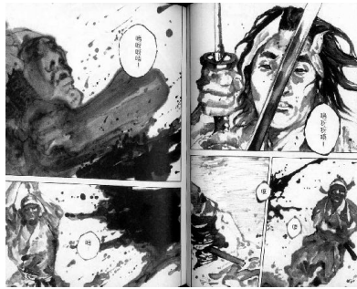
水墨風格的畫法。

另外最具獨特的是作者在漫畫中的水墨應用，利用墨的深淺表達方式，表現出人的內心情緒，像是害怕、激動、緊張等等的氣氛；也可表現角色的遠近關係，墨色較深的為近、淺得為遠；除此之外還有血跡噴灑的美，這樣的水墨風格在漫畫連載越到後面幾集越是使用的頻繁，甚至井上雄彥靠著這樣的技巧，出了一本以水墨畫法為主題的畫冊，也證實了他這種創作方式受到了肯定。