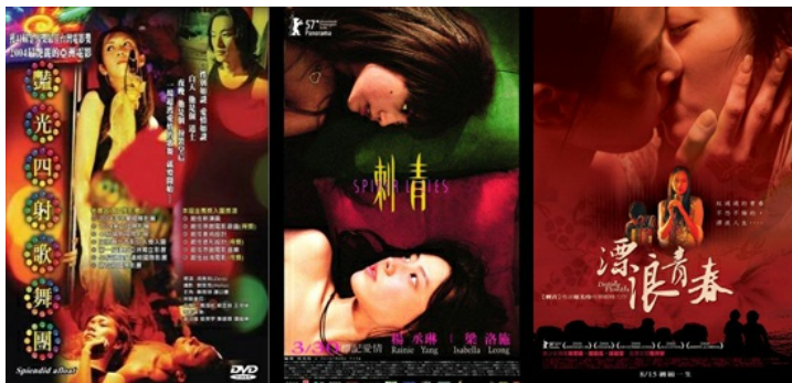
電影宣傳海報，自左起依序為《艷光四射歌舞團》、《刺青》、《漂浪青春》。

2008年暑假，《漂浪青春》上映，加上2004年的《艷光四射歌舞團》與2007年的《刺青》，同志導演周美玲完成了她的同志六色彩虹系列電影的其中三部曲。其中《艷光四射歌舞團》是黃色，《刺青》屬於綠色，《漂浪青春》則是紅色。六色彩虹系列電影這個想法，源自代表同志驕傲的符號——六色彩虹旗，每個顏色都有其不同的意義，周美玲計畫將每個顏色都發展成一個故事，各拍成一部電影，期待自己有生之年能夠將之完成，來呈現出這個時代華人同志們的生命圖像。