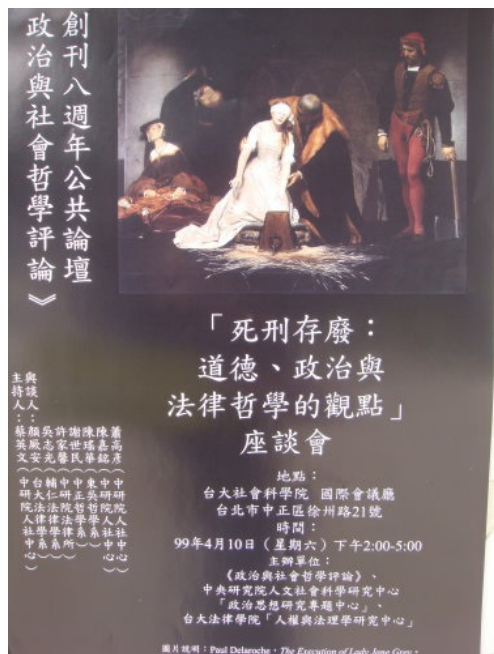
「死刑存廢：道德、政治、與法律哲學觀點」公共論壇對死刑議題有多元觀點的討論。

二〇一〇年，死刑存廢在台灣關鍵的一年。在前法務部長王清峰因堅持任內不執行死刑而請辭下台後，死刑存廢議題再次浮上檯面，不僅引起各界的論戰，也讓死刑存廢更顯得尖銳，而急需一個明確的答案。