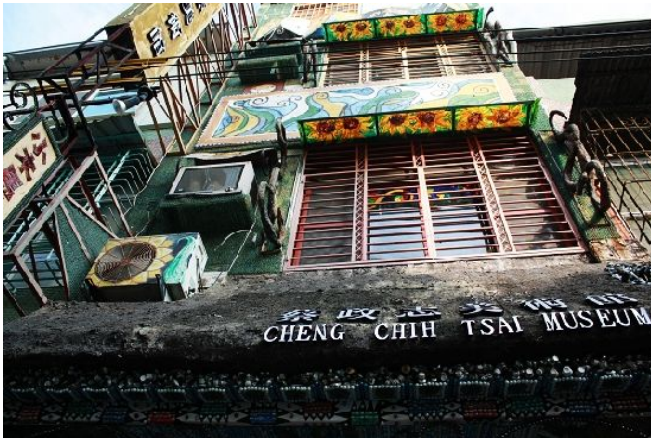
蔡政志美術館本身也是一個作品。