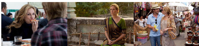
享受生活的羅馬，沉澱自我的印度，尋獲真愛的峇里島。

在一年的旅程裡，主角藉由旅行三個地方，享受了eat,pray與love三種人生樂趣，把過程中遇到的每一個人當成老師，從檢視到發現自我，最後接受自己的全部，也找到了值得去愛的人。