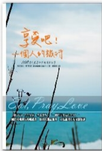
電影原著由伊莉莎白吉兒伯特依親身體驗撰寫而成， 由108則享樂與平衡的故事組成，連續蟬聯17周暢銷冠軍。(圖片來源/博客來)

與其它改編電影一樣，《享受吧！一個人的旅行》也難逃被拿來與原著比較的命運，要將一年的故事、主角情緒轉變皆完整呈現在大銀幕上並非易事，濃縮成140分鐘的電影後，難以細膩刻劃主角微妙的心情轉變，主角在旅途中發生的每一件事都是帶來下一個轉變的契機，但從文字轉化成畫面時卻顯得有點囫圇吞棗，讓人難以消化，這也顯示出了改編電影一直以來的難處，在片長限制下，少了些文字的深刻與能帶來的想像空間。