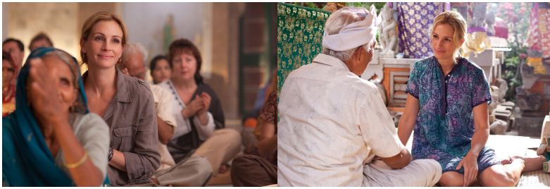
奧斯卡影后Julia Roberts美麗智慧兼具，收放自如的演技，將主角的徬徨與勇敢完美詮釋。