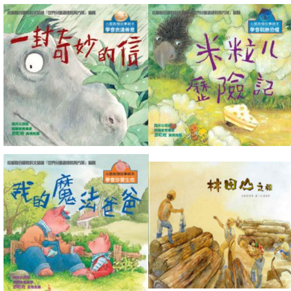
繪本伴隨許多孩子走過童年，除了為他們帶來不可取代的童年回憶外，也讓許多人因此立下未來成為繪本作家的志願。

在稿件成熟度不夠、獨立出版又缺乏通路的情況之下，繪本新興作家的出道之路顯得困難重重，除了對繪本創作不屈不撓的熱情外，如何在累積作品的同時，兼顧市場趨勢與通路問題，也是這些新興畫家必須學習的，因為對他們而言，真正的挑戰有時反而是在完成作品之後。