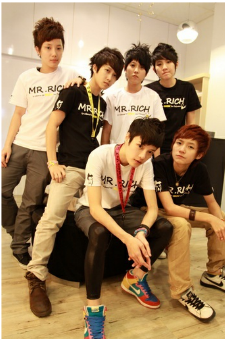
Mr.Rich服飾品牌以小版、中性為訴求，讓穿衣打扮多了一個選擇，且開創以T為專屬模特兒的先例。

時代的進步開放，讓女性的穿著打扮不再受限於傳統觀念裡，中性穿著也能展現出新時代女性的精神。Mr.Rich開創新局，以中性小版為設計理念，抓住許多拉子的心。從網路經營到多家實體店面，並以T為專屬模特兒，足以體現當代女性自我意識的高漲。逐漸脫離傳統服裝的古板思想，中性風格女性不會默默噤聲，而是利用其所能帶來的影響力，展示特有的生命力。自信、獨立、強悍的風格漸漸成為可選擇的項目，不會讓高跟鞋、迷你裙專屬於前，並且，有朝氣的穿著也能獲得婆婆媽媽們的喜愛與認同。做自己最重要的理念是當代思潮，也影響到女性在穿著打扮上自我意識的抬頭，盼望不久的將來，街道上可以出現更多中性小版的服裝店為民服務。