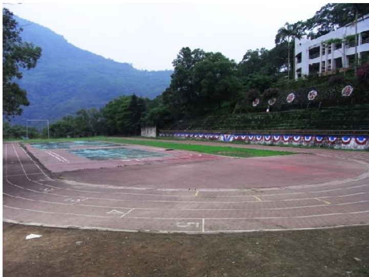
上課中空蕩的操場，下課後即將是棒球隊的訓練場地。（攝影／蔡欣穎）

但是，這些孩子同時也面臨了課業與棒球上的拉扯，有些家長選擇讓孩子練棒球，有些則希望孩子好好讀書，參加課輔。無論如何，這些在山上成長的原住民孩子，都帶著樂天的個性與笑容，快樂的迎接每一天。