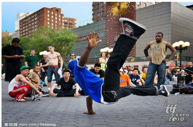
來自不同國家和地區的街舞愛好者參加精英街舞展演。