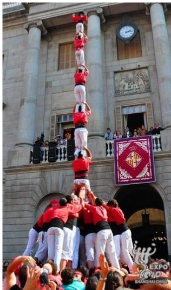
西班牙的搭人塔表演。

以「城市、讓生活更美好」為主題的上海世博會，是第41屆世界博覽會。官方預測到會期結束時，將會有7000萬人次的參觀量。雖然不知道是否可以達到這個目標，不過以目前漸入佳境的狀況來看，世博會無疑已經讓上海，這座多元文化的國際型城市更添了滿滿人氣。