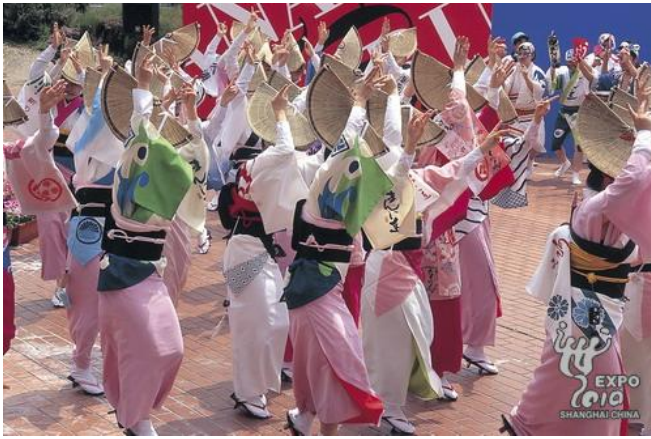
日本大阪的阿波舞舞蹈表演。