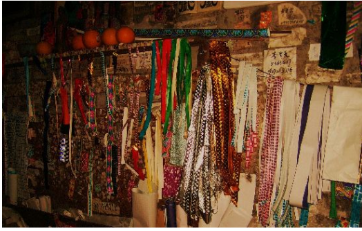
牆上掛滿了糊紙用的彩紙，閃閃發光。(攝影／童于蕙)