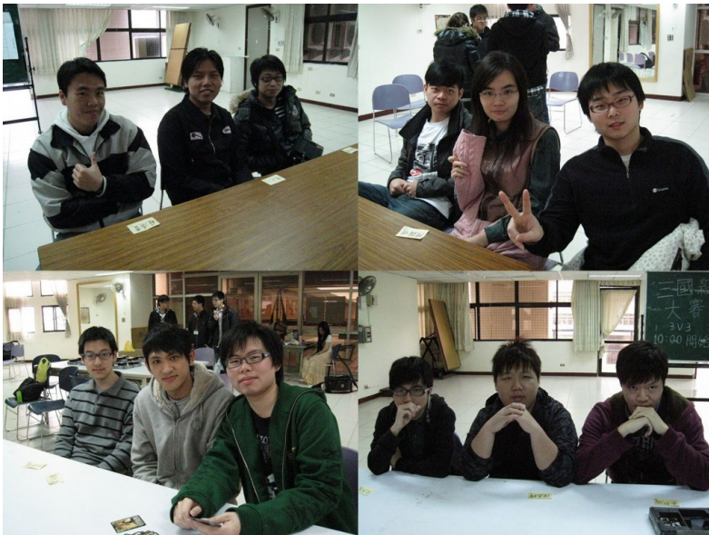
這是一場戰爭，而選手們當然也都通通蓄勢待發準備面對敵人。