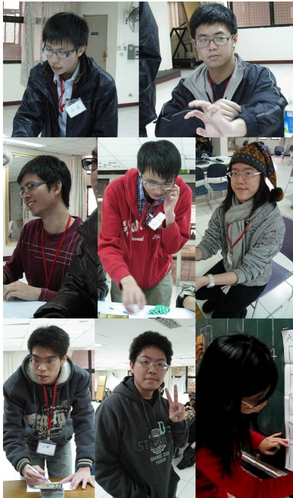
桌遊社的幹部們在比賽中扮演裁判、陪打的角色，非常辛苦得主持著自己舉辦的比賽。