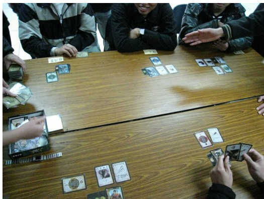
每一步路都要思考的很仔細，不然只會讓自己的戰友們死亡。