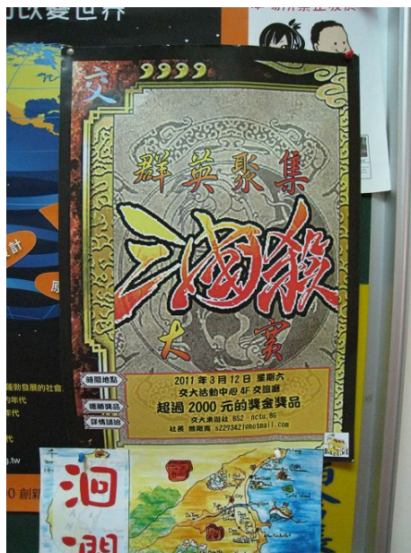
貼在校園各角落的比賽海報，告知所有人比賽的到來。

交通大學成立第二年的「桌上遊戲社」，在3月12日舉辦了一場桌上遊戲競賽，以大陸為火紅的遊戲「三國殺」為比賽遊戲，邀請清交兩校所有學生參與。一方面希望能夠讓更多人瞭解桌上遊戲，一方面為平時都是私下自己玩遊戲的同好們，提供一個公開遊玩的場所。