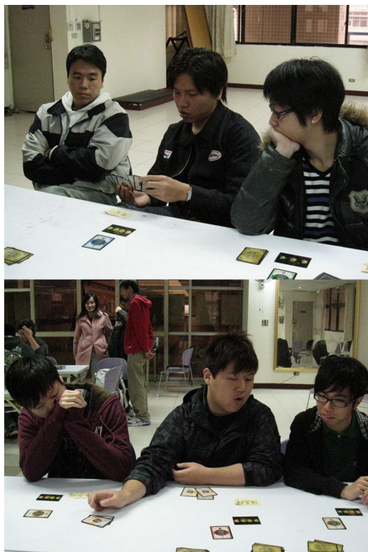
打到最後的冠軍賽時，氣氛變得非常沉重，選手們大多屏息看著自己隊友的動作。