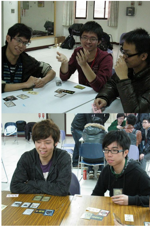
不過桌上遊戲本來就是一款人與人交流的遊戲，過程中也是有許多讓人感到開心愉快的事情發生。