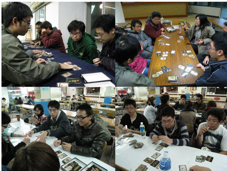
為了讓大家直接瞭解什麼是桌上遊戲，桌遊社的幹部挑了兩天到女二餐廳和二餐去直接進行試玩活動。