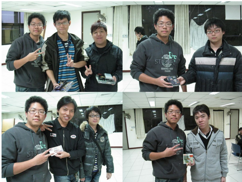
比賽一定有勝負，幾家歡樂幾家愁，拿到獎品獎金當然很高興，但即使輸了，今天的活動卻也讓大家找到了一起遊玩的同伴。