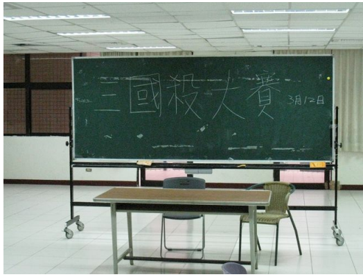
很快的比賽當天到來了。