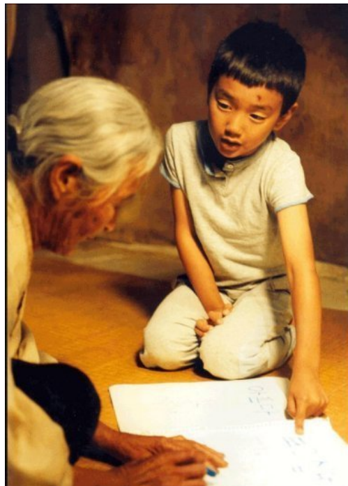
臨走之前，小武著急地想教會外婆寫字。

《有你真好》裡自私慣的小武，在與外婆相處的兩個月暑假期間，雖然不能用言語溝通，但經過生活中的歷練後，小武漸漸感受到外婆對自己的疼愛，開始懂得如何去體諒他人，學會包容與培養耐心。像是在雨天裡不只搶救自己的衣物，還會連同外婆的衣服一起收進屋內；知道外婆賺錢的辛苦，所以小武忍住自己對於物質的渴望；為發燒的外婆蓋緊衣被，幫忙準備午飯。到最後媽媽來接自己回家之前，小武事先為外婆穿了好幾條針引線備用；還教不識字的外婆寫字，「寫這樣表示『我病了』！這樣是『我想你』！」小武很著急地想讓外婆快點學會寫字。