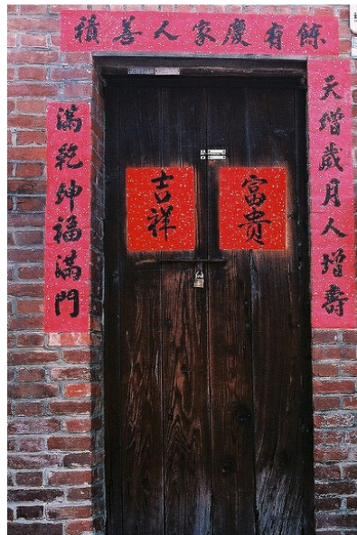
大紅赤豔的春聯貼在老舊的木門上，似乎嘗試為落寞的鹿港穿上新衣。