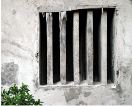
鹿港昔日的風情似乎被鎖在那扇窗之後，默而不語地看著鹿港的變化，令人唏噓不已。