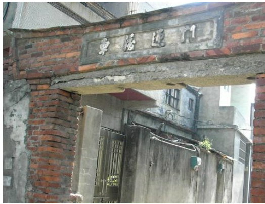
隘門區隔村鎮地域，是百年前鹿港的防禦系統。