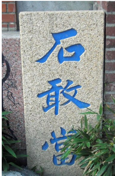
佇立一旁的石敢當，凜然之勢足以鎮煞鬼怪、化解路衝，也見證鹿港歷史的更迭。