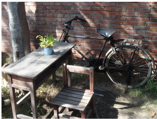
昔日曾經叱吒磚瓦路的鐵馬意氣風發不再，如今只能歇在路旁，宛如陳年老馬。