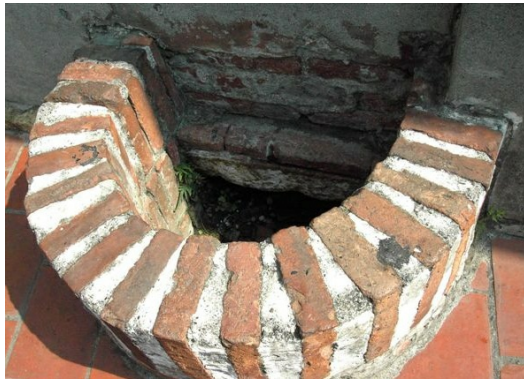
水井被一面牆隔為兩半，一半在牆內供宅院內的人使用，牆外一半則慷慨濟人，讓人自行取用，代表著鹿港濃厚的人情味。