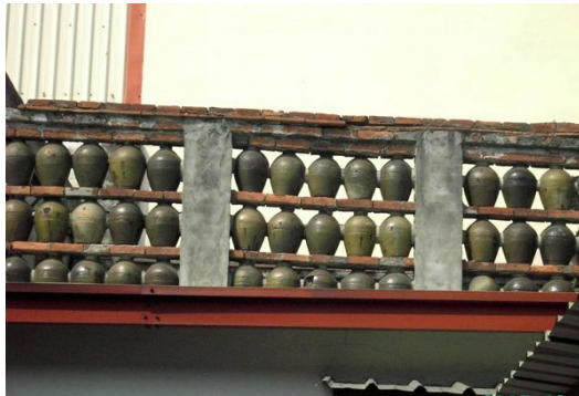
遠遠看到的甕牆，就像一面立體大算盤，算盡鹿港過往的風華。