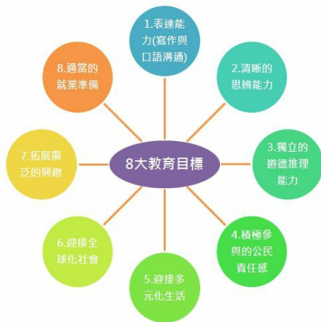
Dereck Bok認為大學教育應提供學生的八大能力。(圖表製作／潘珮瑄)