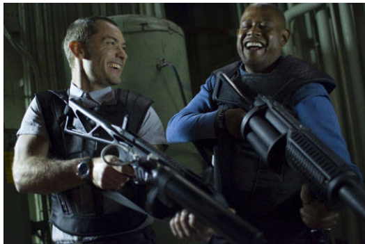
器官回收員在結束一個人的生命時仍然面不改色、有說有笑。

在沒有歷經相同痛苦之前，既得利益者看不見社會上亟待解決的問題，他們想到的，永遠是該如何將手中的利益握得更緊。