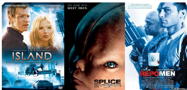
此類型的電影從左至右分別是《絕地再生》、《人工進化》和《索命條碼》。

去年上映的《人工進化》同樣敘述科學家為了滿足私慾，自行「創造」出結合多種生物基因的新物種，原本自以為貢獻良多的科學家怎麼也料想不到，自己發明的新物種最後會暴起反抗人類；《索命條碼》整部片以高科技的冰冷感和極度血腥的暴力場景，描繪一個可怕無情的未來世界。以此為主題的電影皆帶有濃厚的警世意味，究竟最後逃亡的兩人能否擊敗力量強大的聯邦公司？本片結局十分令人玩味，不怕血腥的觀眾可以自行在電影中尋找答案。