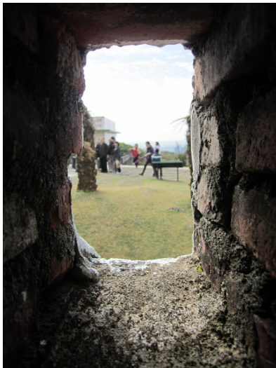
槍孔依舊，但從孔外的世界早已不同。