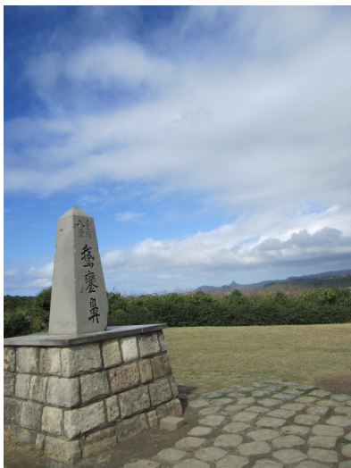
歷史中，鵝鑾鼻燈塔經過兩次炸毀，三次重建，期間被日本政府選為台灣八景之一，這裡常有超級大批的遊客聚集拍照。