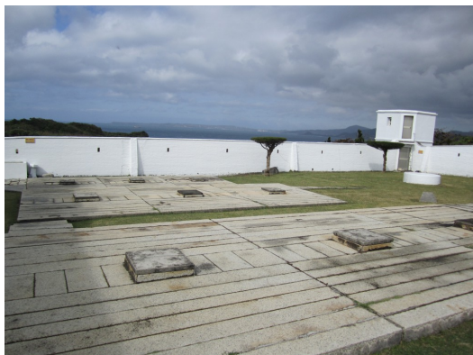
這片看似用途不明的平台，正是貯水槽，即使被圍城也可以支持半年以上。