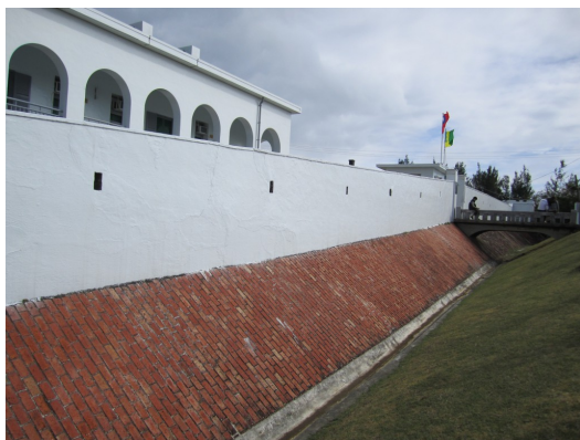
這條溝渠在舊時作為護城河使用，以抵擋剽悍的龜仔角社原住民。