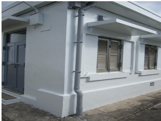
由於軍事化用途，加上珊瑚礁地形貯水不易，燈塔內部建築皆為坪頂，接有導管，直接收集雨水。