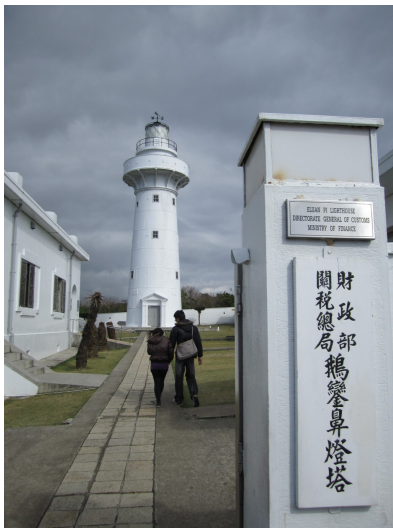
來到舊時的台灣唯一武裝燈塔，現在則是情侶出遊的好地點。燈塔不開放登樓，但塔牆內部可以參觀。