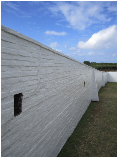
城牆上設有槍砲孔。