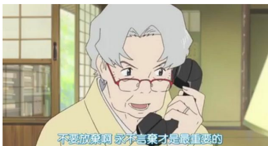
奶奶拿起電話一通接一通地打，鼓勵所有的人。

遇到危機時，奶奶拿起了話筒打出了一通通的電話：「不要灰心，儘可能地多幫助別人。」「不要洩氣，讓我看看你的骨氣！」翻出所有的通訊錄，所有的卡片，奶奶將自己所能聯絡上的人全部聯絡了，就為了給他們鼓勵、給他們勇氣，告訴他們：「堅持下去。」即將展開與A.I.的最後一戰時，萬助說到了他們陣內家族以前戰鬥的歷史，有人說：「但是最後輸掉了啊。」但萬助回答：「這不是說能打贏就打，打不贏就不打的問題。我們家是明知道會輸也會去打的啊。每次都是這樣。」