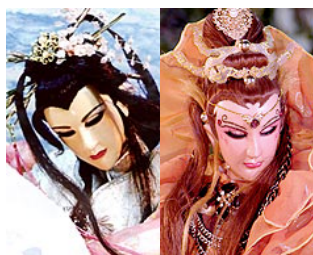
證明女人不只是女人角色之一「傲刀繡鸞」，原本為手無縛雞之力的公主，卻不願向苦情的命運低頭，後期蛻變成一方女帝。

，如於《霹靂外傳之葉小釵傳奇》中的出場「病蘭花」便一生坎坷，一開始設定上為幼時家破人亡，儘管身旁有著對其悉心呵護的朋友和情人，最後仍在經過幾番變故後，為維護自身逝去的貞節而毅然決然地選擇上吊自盡。