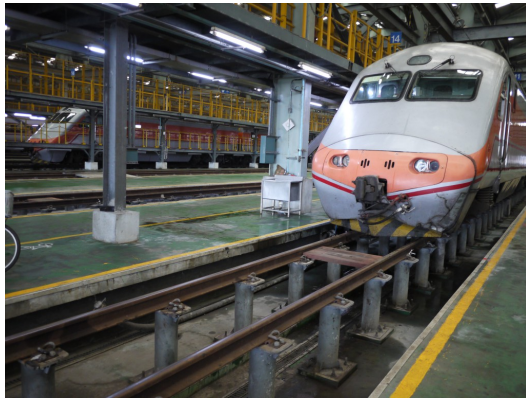
經歷一連串的汗水與照護，火車檢修完畢，準備出站繼續服務旅客囉！