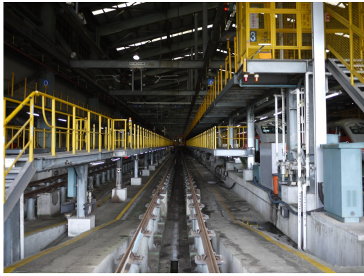
列車從室外軌道一路駛入檢車站，台北檢車段分作16股道檢修不同車種。