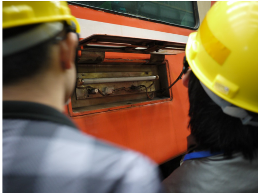
台鐵人員耐心地為民眾解說列車的各種設備，對列車年限、車況、零件耗損率瞭若指掌。