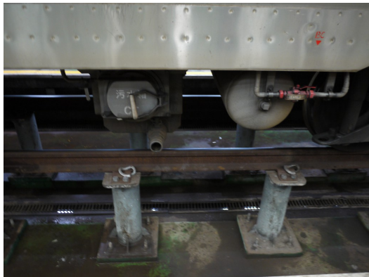
平時較少人注意的列車車身及車底，布滿了使火車順利運行的各種機關。 圖中的污水孔即為列車廁所排放物的出口，需要特別仔細清洗。