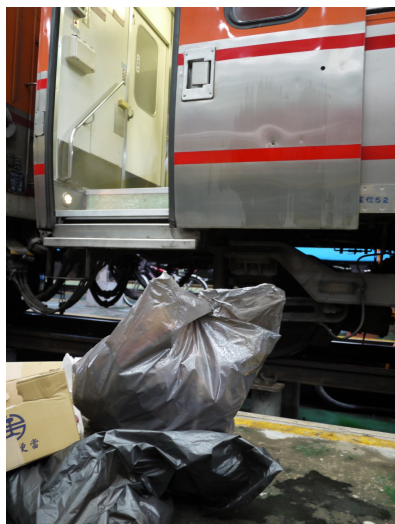
平時乘客在車上遺留的垃圾亦在此時徹底清理，工作人員仔細整理成堆