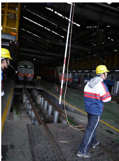
檢修段裡，工程人員辛動的在列車間穿梭，並全程佩帶安全帽以策安全。