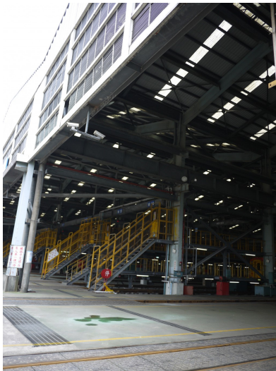
台灣一共分為台北、高雄、花蓮三個機廠；七堵、台北、新竹、彰化、嘉義、高雄、花蓮七個機務段；以及台北、彰化、高雄三個檢車段。

就像人需要定期健康檢查，火車日夜跋涉亦需定期接受檢修。台鐵火車維修保養部門為機務處下轄的機廠、機務段及檢修段，機廠負責修理火車嚴重損毀情形；機務段負責有動力的車廂如莒光、自強號火車頭及EMU電聯車；檢修段則負責無動力車廂維護；每輛火車根據車種及出廠年份差異，30至60日需進廠檢修一次。從列車檢修、洗車、安全措施檢查到運用檢修，工程人員仔細地觀察、聆聽、詢問，將列車調整至最佳狀態。