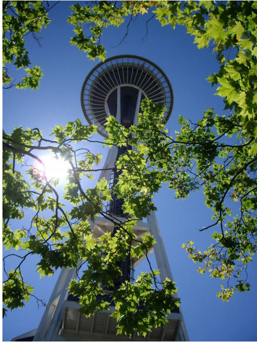
若少了周圍的植物陪襯以及太陽的光點暈染天色， 著名地標太空針塔怎麼看也只是一個造型怪異的建築物。

我想用牽一髮動全身或者蝴蝶效應形容城市建築對於人類的影響，如同眼界、視野、遠見，這些不斷出現在政治、財經報導的專業用語，同時也是決定性地改變個人與國家的生命歷程。思考台灣為何總是迫於國際情勢被打壓的成因，除了不可抵擋的外力影響，內部長久的文化積累卻令人充滿感嘆。每每目睹了美日韓等強國無形的吸引力，無論他們展現的方式是長年釋放或者短期爆發，都令我深深地反省台灣吸引觀光人氣的招數。不能只靠夜市、美食和溫暖的人情味，而是透過公家執政者的雄心壯志和私人企業的鼎力支持，以及廣大市民所共同孕育的文化建設。