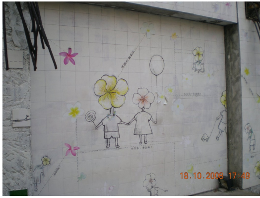
台南市海安路兩旁的創意塗鴉，由眾多藝術家聯合創作，風格多元並結合當地人文，是名副其實的文創觀光景點。