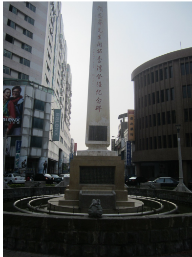
位於雲林北港的顏思齊拓墾紀念碑。 此人正是鄭成功的老爸的老大，在正史中是無惡不作的海盜，但在地方野史裡卻是墾荒英雄。如今高樓林立， 顏思齊碑卻未隨傳統建築消失。