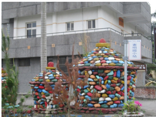
在早期台灣，這種形狀的米倉隨處可見，台語稱作古人畚。 如今，這曾經不起眼的日常用具，卻成了裝置藝術所操作的符號。