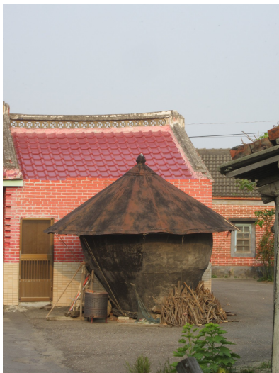
仍在使用的正版古人畚，一旁堆疊的是燒水用的柴薪。 順帶一提，這個古人畚已被收藏家看上，喊價到五萬塊了。