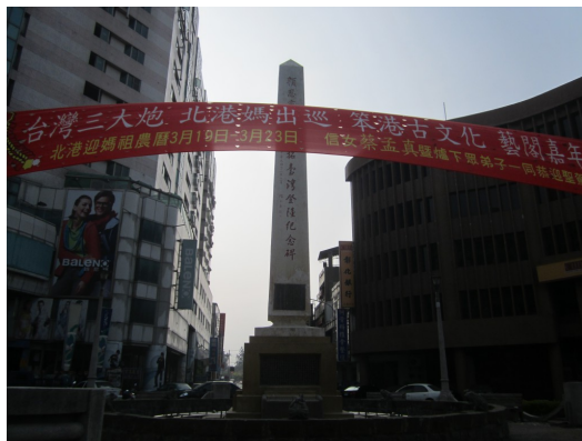
碑能留下來，和在前方飄揚的布條有很大關係。 正由於北港強大的信仰凝聚力，讓它在整個雲林都陷入農村人口外流的絕境時， 仍能保持一片欣欣向榮，從而傳承並發揚固有的文化，最後聞名全台。