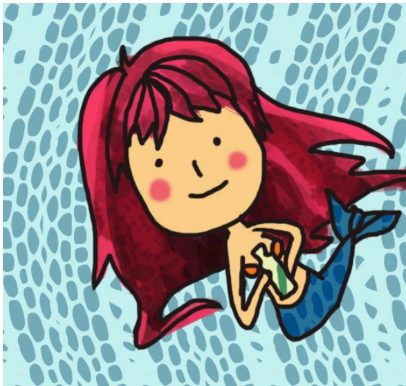
雖然速度很慢，但朵栗很喜歡瓶中信古早、質樸的感覺。(繪圖/康甯)

又是一個平凡的下午。朵栗依照慣例寫信給他遠在陸地上的筆友—小龍女。朵栗和小龍女通信好多年了，兩人是彼此唯一訴說心事的存在。雖然現在流行飛鴿傳書，但因為海裡沒有鴿子只有飛魚，朵栗也不能到陸地上，所以她只能將信捲好，用珊瑚藻打個漂亮的結，再將信小心翼翼地放進玻璃瓶裡；等到洋流經過時，將瓶子放進洋流，讓信順著海流漂到岸邊。「瓶中信」是她們聯絡的唯一方法，這也是碩果僅存的古早方式了。雖然慢，但朵栗覺得這種樸實的方法更能展現誠意，她想將這種方法保存下去，而且也認為飛鴿傳書千篇一律的形式很無趣。