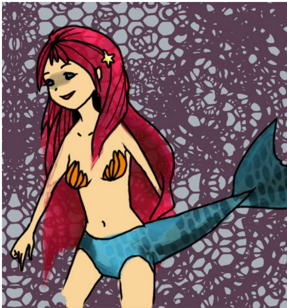
朵莉心中只覺得「這是什麼鬼情況？」（繪圖／康甯）

「該死！！！」朵栗心裡怒吼，「早知道應該喝完整罐的！」昨天喝藥水時，朵栗在喝與不喝之間天人交戰，最後她決定採取中庸之道—只喝一半，沒想到卻成了現在這副窘境，這種心情就像拔粉刺卻只拔了一半出來那樣無奈。她搖著尾巴，沿著沙灘走著，思考著該怎麼辦。「就跟小龍女說我是人類跟人魚的混血兒好了！」朵栗為自己想到這個完美無缺的藉口沾沾自喜。海水結晶成了鹽在頭髮上閃爍著，她賣著自信的步伐走進山林，踏上尋找的第一步。「山頂上，一棵大樹旁的山洞...」朵栗默默唸著小龍女寫在信上的地址，走了一個上午，沉重的尾巴讓她爬上山來更加費力。「該不會是迷路了吧？信上明明說兩個小時就可以到了。」朵栗疑惑的看著周遭，漫天霧鬱的樹林根本分不清東南西北。她拿起通訊器，想說打給小龍女確定一下地址，之前因為海洋和陸地間的通訊費十分昂貴，她們從來就沒想過要打給對方。「嘟嚕嚕嚕嚕...」響了很久，卻一直沒有應答的聲音。朵栗關閉通訊器，在樹邊小憩了一下，舉著尾巴繼續往前走。