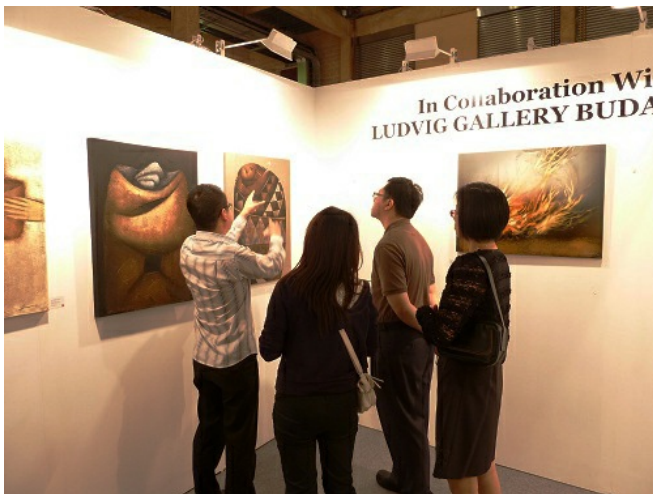
台北新藝博會同時也是很好的市民藝術教育場所，因為不管你是不是藝術收藏家，只要你有疑問，你都可以聽到大師級的講解和介紹。