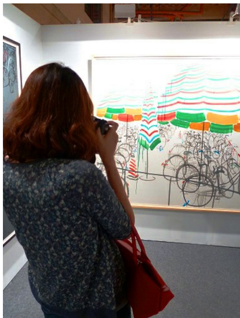
喜歡卻買不起，就拍照吧！不同於台灣美術館，展場內的作品都是可以照相的。