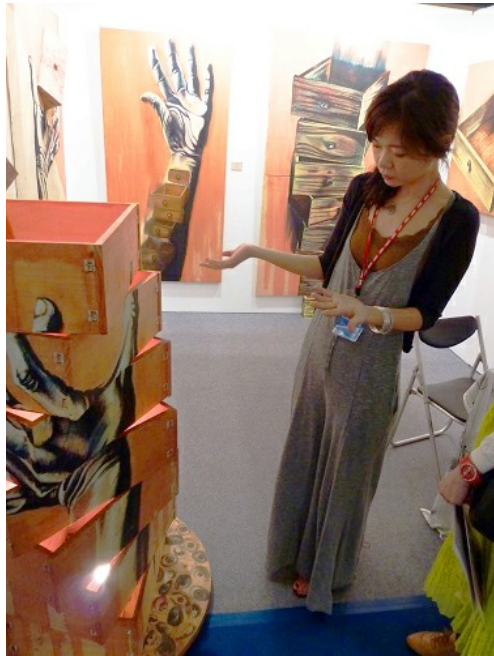
台北新藝博會特地捨棄一般藝博會的畫廊制，改由以藝術家個人為參展單位參展，藉由這樣地規劃，藝術家和民眾可以直接接觸、溝通。