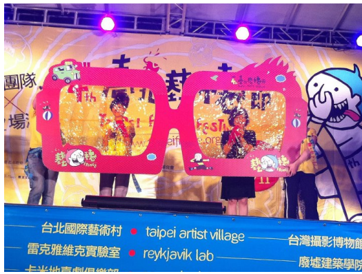
藝穗讓人「跌破眼鏡」，貼玻璃紙其實是一門大學問。

找到人就畫，不用想太多，筆在臉上揮灑，五顏六色的顏料，把臉變成一隻隻不同的珍奇異獸。我拿手的項目是羽毛類，鳥兒很美麗，而且不需要畫到全臉，眼睛勾勒一下，鳥的神韻就出來了，貼個羽毛更添整體華麗度。當被稱讚畫得很美，看到一張張笑臉，再多的辛苦都值得！原本我們很擔心會不會沒有民眾到魔手站來畫，但讓我很意外，當天魔手站的人潮好多，民眾甚至排隊來要我們畫，畫的人大多都為小朋友，小朋友很乖，但出的題目可是樣樣都有，葡萄、二郎神、恐龍...等，考驗魔手們的能力。可惜的是，較少年輕人來找魔手們畫，多數都不畫臉而是畫手，但也有老爺爺來找我們畫，當老爺爺坐在椅子上安靜地讓我們畫，就知道我們成功了！