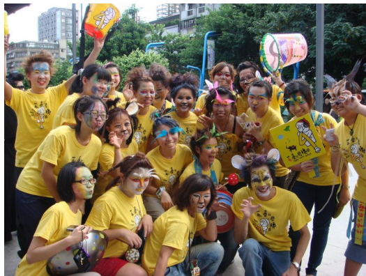
第四屆台北藝穗節成功！好喜歡大家，一輩子的回憶！

遊行歡天弄鼓開始了，從電影公園走到紅樓，晚上六點走到九點，短短的一段距離，但卻成為我一輩子的回憶，敲敲打打、蹦蹦跳跳在西門町的街上遊走，從來沒有如此走過西門町的街道，臉上帶著妝，幻化成一頭頭野獸，與表演團體一起喧鬧西門町的街頭，表演團體藉著這個機會，宣傳他們藝穗節的戲、音樂、舞蹈和戲劇等，每部戲都好想去看，每樣都散發著他們的熱情與企圖心。我想我之後一定會再參加藝穗節的志工，一當就當上癮，還會再去尋找更多志工的可能性，能學到東西又能服務到人的體驗，真的很寶貴！