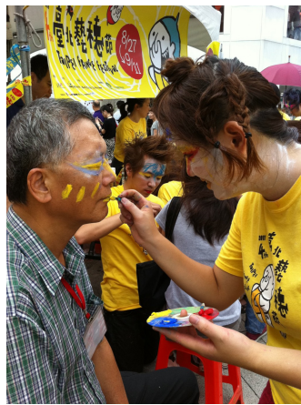
來魔手站的人以小朋友居多，但也有老爺爺來畫。

找到人就畫，不用想太多，筆在臉上揮灑，五顏六色的顏料，把臉變成一隻隻不同的珍奇異獸。我拿手的項目是羽毛類，鳥兒很美麗，而且不需要畫到全臉，眼睛勾勒一下，鳥的神韻就出來了，貼個羽毛更添整體華麗度。當被稱讚畫得很美，看到一張張笑臉，再多的辛苦都值得！原本我們很擔心會不會沒有民眾到魔手站來畫，但讓我很意外，當天魔手站的人潮好多，民眾甚至排隊來要我們畫，畫的人大多都為小朋友，小朋友很乖，但出的題目可是樣樣都有，葡萄、二郎神、恐龍...等，考驗魔手們的能力。可惜的是，較少年輕人來找魔手們畫，多數都不畫臉而是畫手，但也有老爺爺來找我們畫，當老爺爺坐在椅子上安靜地讓我們畫，就知道我們成功了！