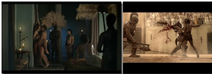
劇中不乏性愛與血腥場面，形成強烈對比。

《斯巴達克斯》不管是畫面、轉場、劇情、選角都相當地有水準，讓我相當地喜歡，而且我覺得各自都可以稱之為一門藝術(在這個影集裡)。整個影集都是圍繞著古羅馬時期打轉，為了符合當時的風土民情，所以會有很多一絲不掛的人(大多是女人)，而且為了營造出讓人有種身歷其境的感覺，整個競技場以及訓練場的打造也是非常逼真。另外值得一提的是，雖然《斯巴達克斯》充滿了大量的血腥場面，像是頭被砍斷、被劍插進身體、把陰莖切掉等等，那種灑血的表现方式，我覺得可以堪稱上是一種藝術，不會讓人覺得反胃的噁心，反倒是有種讓人沉浸在殺戮快感中的感覺，每個噴血的鏡頭都用slow motion來呈現，似乎是在彰顯著一場美麗的饗宴。