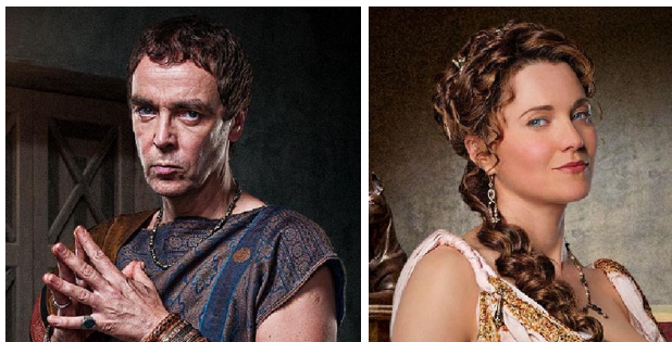
《斯巴達克斯》中的訓練場主人巴蒂亞斯（圖左）與其妻子露西雅（圖右）

不管是哪一部電影，演員的選擇都是相當重要的部分，不一定要非常有名，但是需要能把該角色詮釋地非常好，這點在《斯巴達克斯》裡面也是相當令我讚嘆的。俊男美女不用說，看看男性—角鬥士主角們的結實六塊肌，全身的肌肉像是要噴發出來般地張牙舞爪著；而女性—不管是身為貴族或是奴隸，都擁有著好身材，有時更可讓觀眾大飽眼福地展露出她們美麗的裸體，讓人不禁讚嘆造物主的巧奪天工。在演員們的加持下，讓相驗刺激的性愛畫面增添了不少與眾不同的氣息，讓人覺得性愛彷彿是一場崇高的祭典，代表著神聖而不可侵犯。