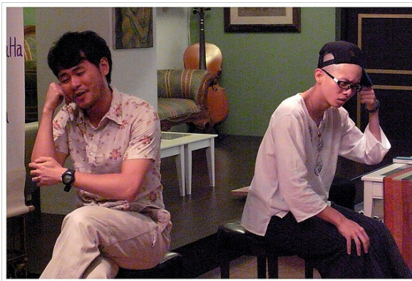
工程師阿宅碰上神秘的塔羅牌算命師，兩個人的人生會如何臭味相投？