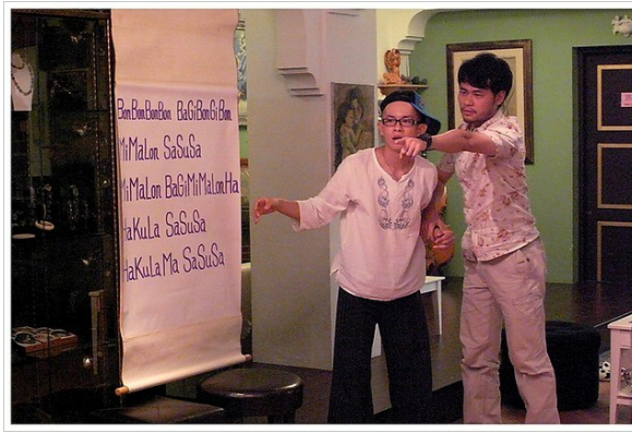
看似胡鬧的占卜過程，其實正慢慢地解救了這兩個人，以及在場的觀眾。