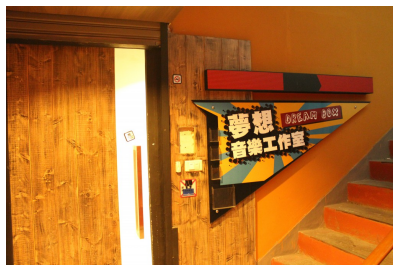
今年五月剛成立，一間全部由自己打造的夢想音樂工作室。

Dream box 夢想音樂工作室，音樂教室與專門在賣樂器的工作室，是小孟與另外三位老師的其中一個夢想。今年五月剛成立，本來是小孟的個人工作室，叫做mister dreamer，但是原本的地點太小，並不如他所期望的一樣。所以換了個地方，換了個方式，與其他老師合夥，重新再出發。最早工作室的名稱是因為名字裡有「孟」這個字，所以就以其諧音「夢(dream)」取作mister dreamer，翻成中文意義即是夢想者。後來因為先前的名號已經打響，再加上這是四位老師共同的夢想，便取名為「夢想音樂工作室」。