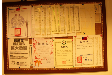
多張學校的聘書與感謝狀。

教學是一直釋放，但卻無法吸收的事。教久了難免會退步、倦怠，只要一遇到瓶頸，就會到台北去進修。教學的數量會漸漸收掉，之後朝向重質不重量的方式招生，會挑選學生。「只要有耐心，沒有很難教的學生。」小孟是教學出身的吉他老師，但現在比較多表演出身的老師，而後者常會被捧得比較高。但是很厲害的人不一定很會教，而且他們比較沒有耐心，這樣對學生不好。小孟自認自己在台上演只有到及格的程度，但是教了學生會懂，且是個有耐心的老師。因為有耐心，新竹很多學校的吉他社都請他當老師，而他也希望學生能得到最大的回饋。