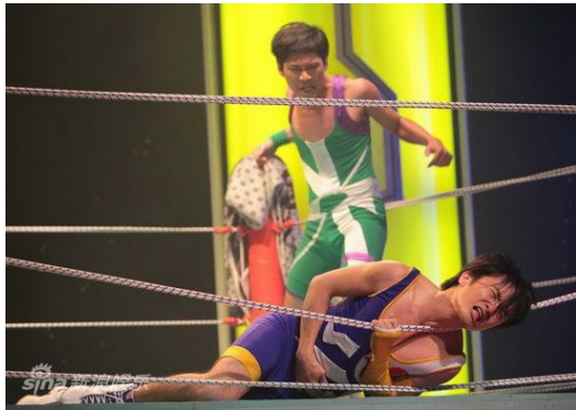
只有汗水沒有口水的兩黨格鬥賽。

另一個橋段—藍綠政黨擂台賽，主打喜好政論節目的觀眾，與其看名嘴們說得口水橫飛，不如讓台灣兩大政黨實實在在地打一架。舞台上搭起簡陋的擂台，呼應著瘋狂電視台經費不多的狀況，演員們穿著兩黨代表色的角力服，在擂台上抓住對方的弱點後，就是一陣猛烈的攻擊，演員們搏命演出，真實程度讓人不禁懷疑看的是舞台劇還是格鬥賽。而「一鏡到底」式的情境劇，利用一台攝影機同步拍攝及播出方式，使得演員必須迅速換裝，狼狽模樣令人莞爾，此時觀眾可上台成為情境劇的配角，適時加入劇中，但也因為一鏡到底的拍攝，不容許有笑場的情況發生，但《瘋狂電視台》卻讓最不受控制的觀眾上台，要台上台下一起瘋狂。