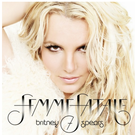
布蘭妮2011年全新專輯《蛇蠍美人》。

2011年全新專輯《蛇蠍美人》（Femme Fatale）被極具權威的《Rolling Stone》雜誌打了四顆星，並稱之為『布蘭妮最好的一張專輯』，樂評人喬迪羅森說：「很少有流行天后會推出這樣從始至終節奏感都非常強的專輯。」