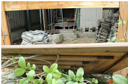
紀州庵本館慘遭祝融之災仍待修復，但政府力有未逮，現場已植物叢生。

現今的紀州庵被台北市政府列為市定古蹟，分為兩大部分：一區為已完工的紀州庵新館，一區為紀州庵舊址。由於舊址還有一戶居民不願意遷出，所以遲遲無法動工，形成目前兩區極大的對比。紀州庵鄰近爾雅、洪範等純文學出版社，離詩人余光中舊居也僅幾街之遙，台北市文化局目前將此塊區域規劃為城南文學公園，希望營造此區的文化氣息。目前紀州庵新館已於去年開放，不定期展出台灣戰後文學家的作品。