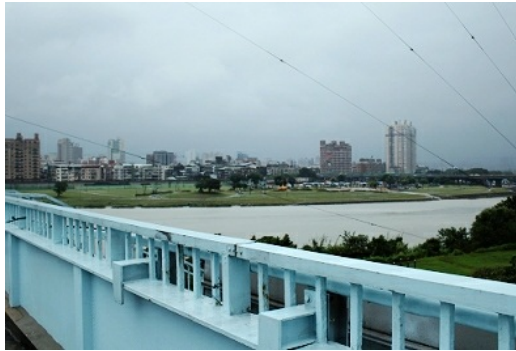
紀州庵緊鄰新店溪畔，孕育特殊的水岸文化。

大河那裡。其實若從河堤上看下來，同安街上沒有幾個行人，白的街身，彎彎的走向，其實也是一條小河。」道出了紀州庵寧靜的居住環境與緊傍水岸的特點。