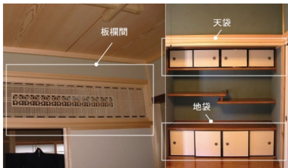
日式建築特色——板欄間、天袋、地袋。

修復工程由師大委託建築事務所負責修繕，維持日式木造建築舊有特色，目前工程已告一段落，正積極招攬文創產業入駐，預計十月底開放讓外界參觀。雅舍繼錢穆、林語堂、殷海光、胡適的故居後，正式成為台北市第五個文學家故居。