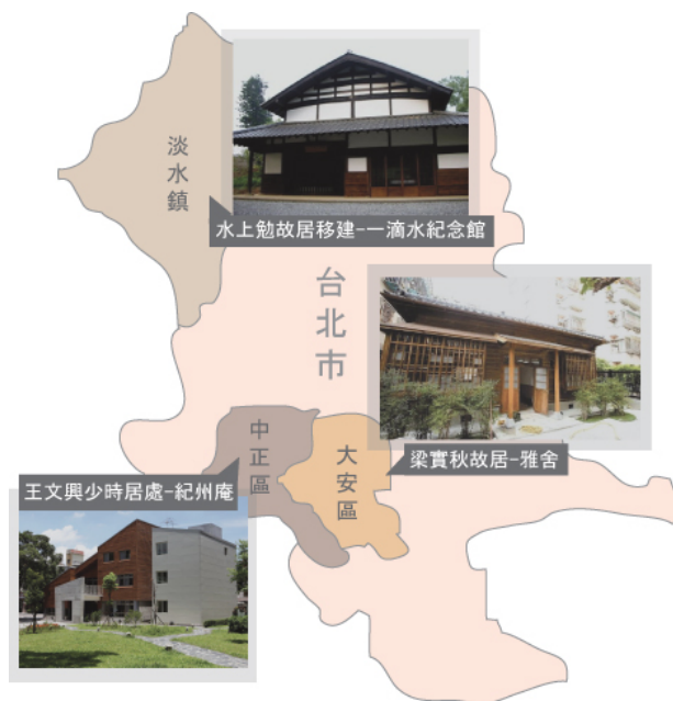
台北地區幾處老屋翻新案，都曾是文學家居住之地。(製圖/蘇冠心)

由於台灣曾受日本長達五十年的統治，因此許多地區都看得到日式建築的影子。日本傳統建築以木質構造為主，其典雅樸實的外觀，總讓人聯想到文人雅士風情。舊時，許多日式老屋都曾孕育出不少文學結晶，更有日本文人故居，飄洋過海到台灣進行重建，日前，這些老屋經過修繕、復原，展現出老屋新風貌。