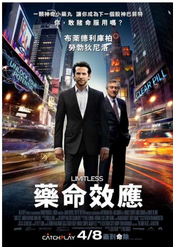
《藥命效應》電影海告

如果有一種新開發出來的藥，能激發你使用未知的腦力，並激發你的淺在能力，你會願意嘗試嗎？