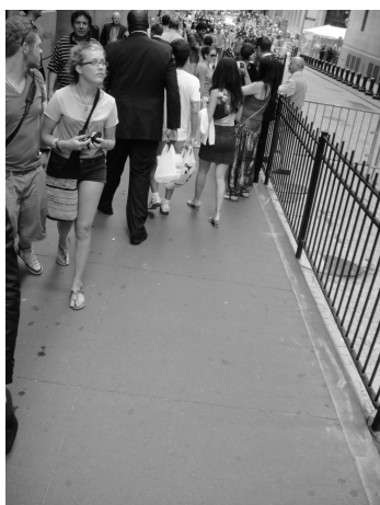
孤單是想講話的時候沒有人聽，也是在人來人往的街頭只能隨波逐流。

另一種讓我想閃避的人，是太渴求遠離孤單的人。其實這跟愛大聲嚷嚷、自我感覺良好、想被焦點圍繞的人是同一群，因為他們只是不想再被忽略了，才選擇用最不堪的方式贏得大家的注意。我沒有任何資格評斷他們的行為，或是指著他們揭穿這一切，於是我走遠。然後和某個朋友在聊天中談到這個話題，才發現我們都遇過這樣的人，並且在走遠之後，我們走進了同一個摩天輪車廂。