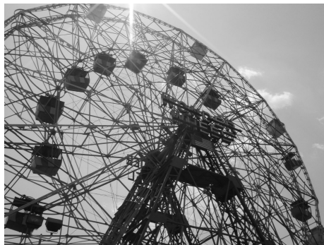
交朋友就像坐摩天輪吧，轉了一圈後，發現彼此不合適就離開，頭也不回。

我還蠻怕一種人，他們大聲嚷嚷，他們深怕別人不知道自己在場，他們需要舞台、需要目光。他們不知道的是——我並不需要他們。真正有能力的人不需要大聲嚷嚷，別人自然會注意到他的光芒。我始終相信很多事情是順其自然，該是我的就躲不掉，不該是我的，抓再緊都將流逝。只是一旦得到了，就要有握緊雙手絕對不放的決心。