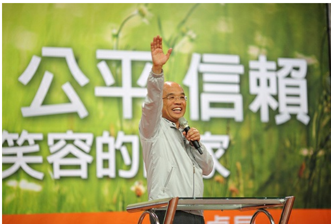
前行政院長蘇貞昌。

在充斥著各式各樣通俗音樂的台灣歌壇中，2011年的九月底，出現了一張不一樣的唱片。繼2010年的台北市長選舉期間發行《Open Taipei》之後，由蘇貞昌創立的超越文創基金會在今年再次推出新專輯《Open Taiwan》。經過了一年的大起大落，蘇貞昌的超越文創基金會發行了這張專輯，期望能凝聚這片土地上所有人的共識，也希望能用音樂串起台灣人的心。聽眾藉由這些作品，就如同穿梭在時空當中，遇見不同族群、跨越不同世代、聆聽不同的聲音。