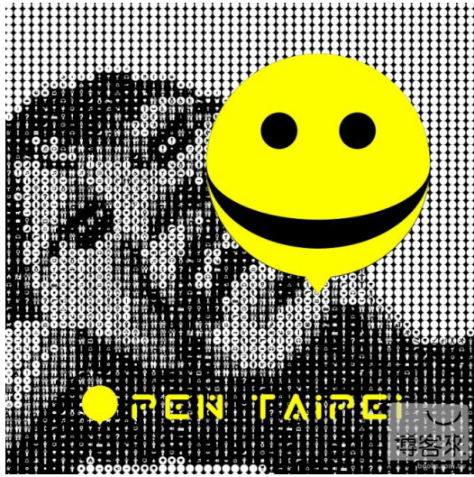
專輯《Open Taipei》的封面。