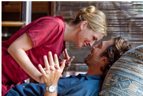
決定再次相信愛情，兩人一起跨越過去，迎向未來。

到底，婚姻是不是女人的必需品？到最後，莉茲還是沒有告訴大家答案，但是她願意選擇再一次相信愛情。