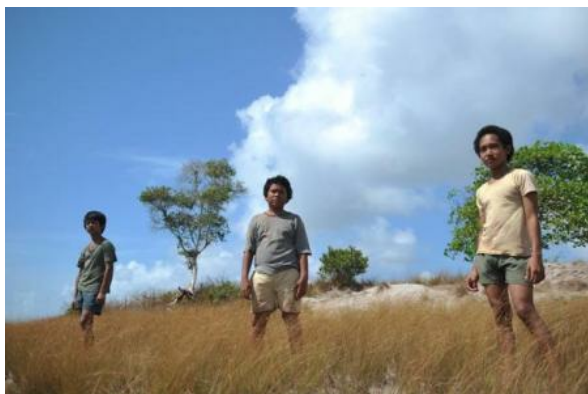
《天虹戰隊小學》劇照

同樣地，故事裡發生的狀況，也會發生在我們生活的世界裡。一些偏遠地方的小學校，遭遇到的也是經費拮据、教育品質低落，縱使有心但卻因為物質匱乏，心有餘而力不足。這些都是在我們看完書後可以值得省思的地方，伸出援手、盡自己的一點點心力，可以從自己身邊開始關心做起。