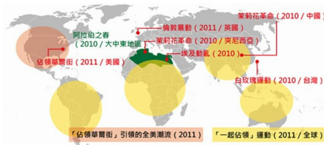
近兩年內藉由社群網站串聯、影響力較大的社會運動。

社群網站的多元化，已深入社會的各個層面。會透過這些網站接觸不同意見的使用者，比起思想單一的人更理性、更具獨立思考的能力。這些快速累積起來的知識，將會不斷改造社會現有的面貌。