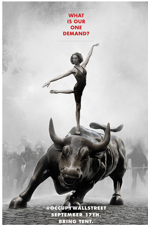
「佔領華爾街」的宣傳海報。

社群網站的多元化，已深入社會的各個層面。會透過這些網站接觸不同意見的使用者，比起思想單一的人更理性、更具獨立思考的能力。這些快速累積起來的知識，將會不斷改造社會現有的面貌。