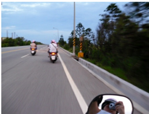
公路上，綿延的是我們開心的笑聲

在島上，我們只要一出發，就是浩浩蕩蕩的二十幾台機車，綿延在公路上的，都是我們開心的笑聲和呼喊，就像澎湖的大車隊一樣，雖然好像太多人了，但是現在我最懷念的就是那一大群人的笑聲和嬉鬧。在廣闊的風景下，如果是一個人，你只能自己把感動記在心裡，但是如果是一群一起分享，那樣的感動所帶來的餘溫是可以保存更久更久的，因為大家一起記憶著回憶中的美好。