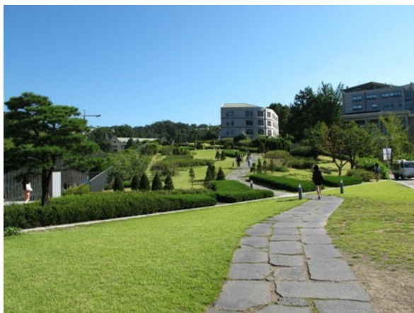
漂亮的韓國梨花女子大學校園

人生第一次自助旅行，在交錯的各種語言、每天走到腳快斷掉下順利完成了，雖然韓國沒有讓我留下深刻的印象，但卻也有那麼一些些感動，好像自己又長大了，也更勇敢了一點，也發現好像沒有什麼不可能，最重要的是你願意嘗試和努力的心意。