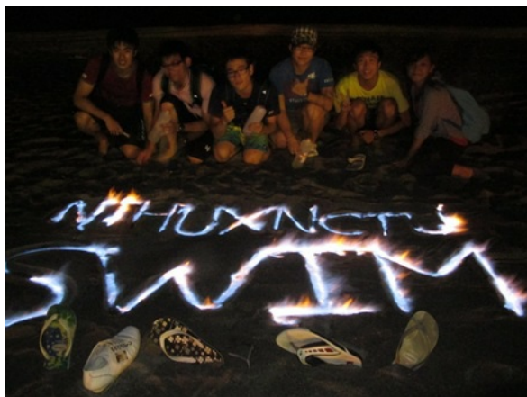
夜晚的沙灘上，我們拍下紀念的印記

在沒有一盞路燈的黑暗山路上，我們馳騁著摩托車，只為抵達一個看星星的好地點。平常生活裡，總是會聽到有人要去看星星夜景的，但是那都不算什麼，在綠島，我真心讚嘆大自然的美好，一直仰著頭，就想要用力地記住那美麗的景象。我大概把一年份的星星都看完了，滿天星斗，是最好的形容詞，再加上民宿老闆，精彩的依著天上的星星，講星座故事，讓人完全沉浸於大自然的懷抱裡。