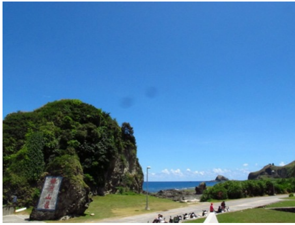
綠島風光