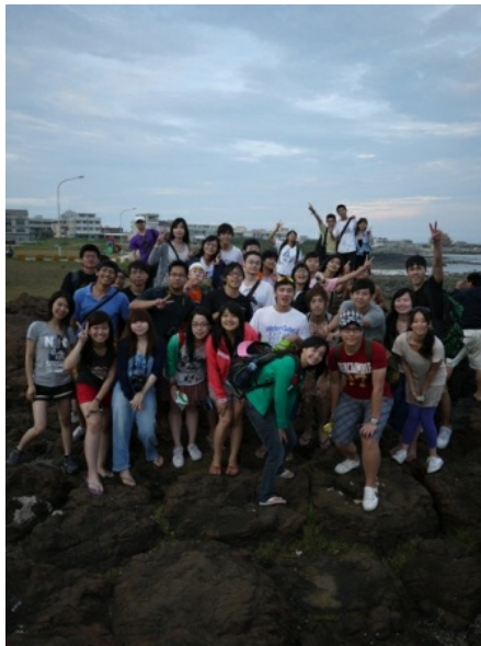
澎湖之旅，浩浩蕩蕩的三十幾人。