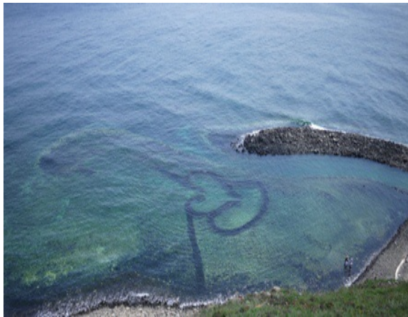
我終於見到地理課本上的雙心石滬

也沒讓大家失望，第一次這麼近距離得看煙火，效果就好像是在電影院看3D電影一樣，伴隨著大家的驚呼聲，覺得煙火都快要掉下來打到你了，絢麗的美感讓我現在想起還是覺得歷歷在目。