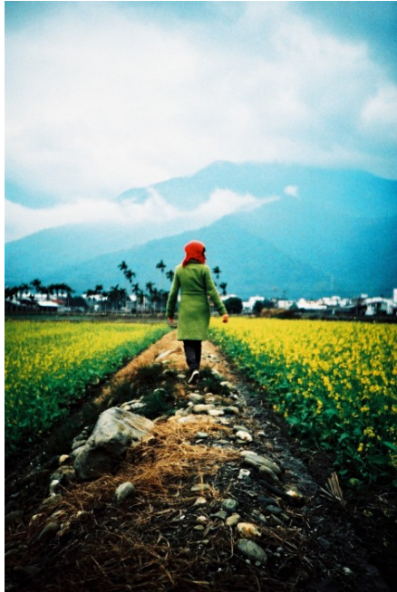
叮咚的眾多作品中，妻子 Cheese 最喜歡的一張照片。

攝影的價值在於，按下快門的即刻能讓美好的畫面永久延續。叮咚捕捉了每一個瞬間，用他簡單的生活態度，帶我們看見每張照片背後的故事，也讓我們透過攝影作品，走入他的生活，感受平凡而深切的情感。他不是偉大的攝影師，他是時光的採集者，也是生活中的實踐家。